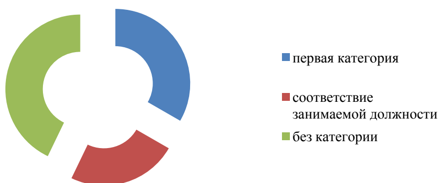
Уровень квалификации педагогов 2016 - 2017 учебный год

В 2016 – 2017 учебном году прошли курсы повышения квалификации 6 педагогов. По плану – графику один педагог прошел процедуру аттестации на первую квалификационную категорию. Два педагога получают высшее профессиональное образование.