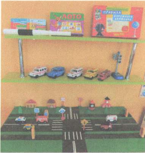
Фото на странице: 6