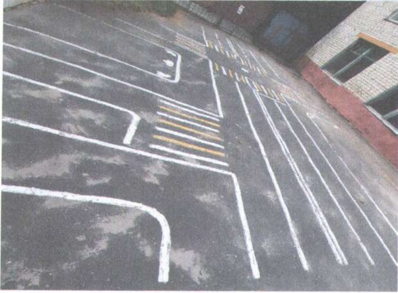
Фото на странице: 1